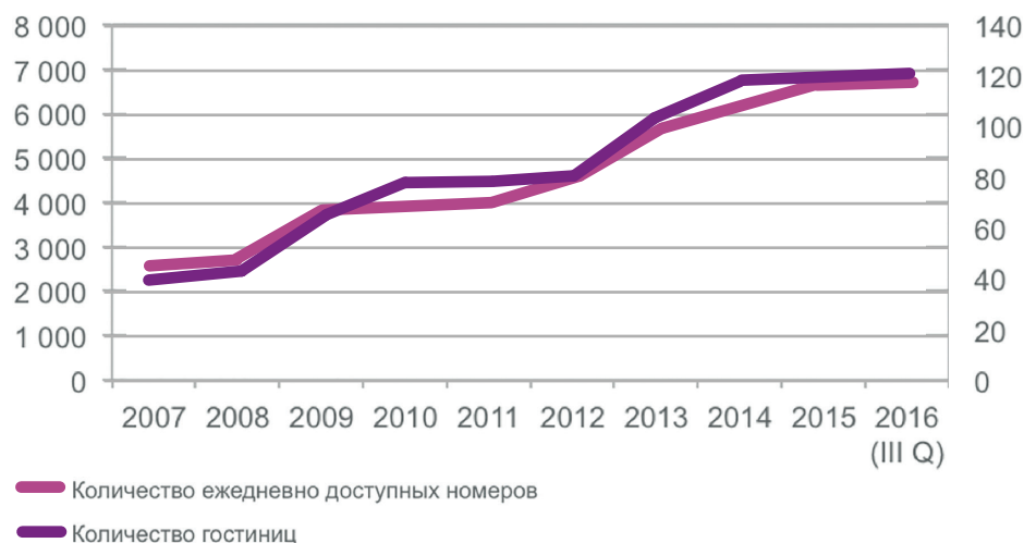
ДИНАМИКА ПРЕДЛОЖЕНИЯ ГОСТИНИЧНОГО ФОНДА КАЗАНИ, 2007-2016 ГГ.

Основную часть внутренних и международных прибытий составляют прибытия с деловыми целями, но в